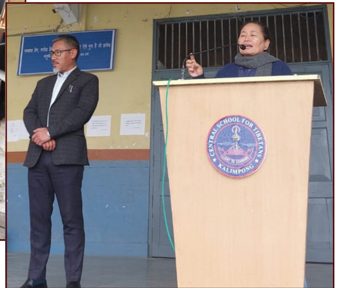
École de Kelsang