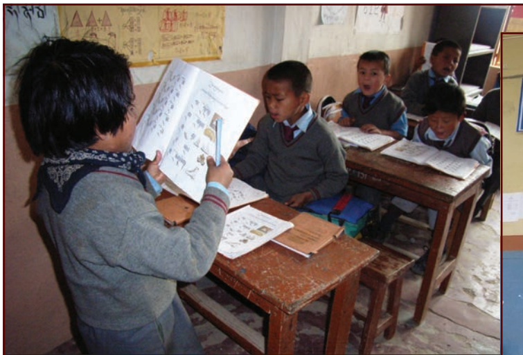
École de Pokriabong

Les enseignants sont tous jeunes et semblent passionnés par leur métier. C'est rafraichissant et excitant de les voir prêts à affronter tous les défis. Au moins 4 d'entre eux sont d'anciens élèves. Je me sens très vieux... Hahaha !»