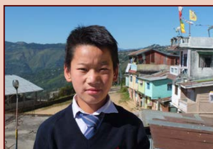
Camp de Sonada

Cela explique que de nombreux jeunes choisissent cette voie qui assure le présent de la famille et leur avenir professionnel, certains filleuls du Toit du Monde optent pour cette voie. Tous ne peuvent pas envisager des études supérieures.