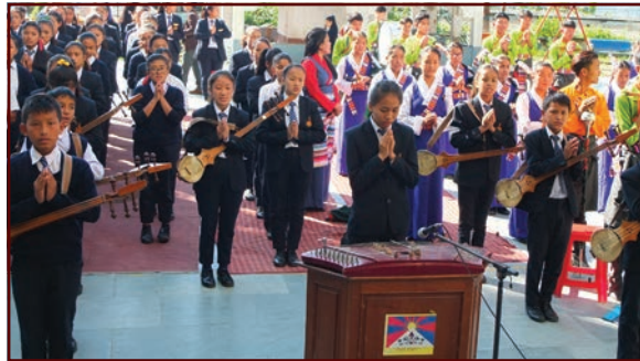
Rassemblement du matin école de Kalimpong et de Tezu

Comme nous l'avions annoncé dans le bulletin de novembre, les 6 dernières écoles sous statut partagé (Central Schools