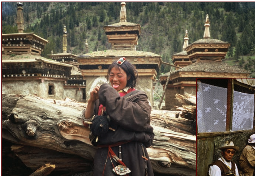
Kham - Tibet 1996