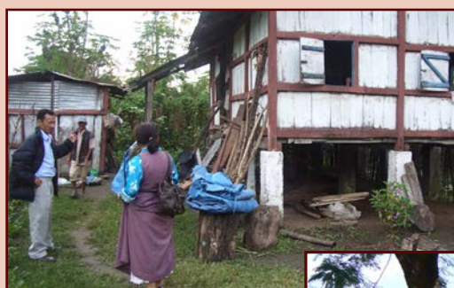
Camp de Tezu

Bien que le Tibet ne soit plus une nation à part entière, reconnue internationalement, et que le Gouvernement en exil