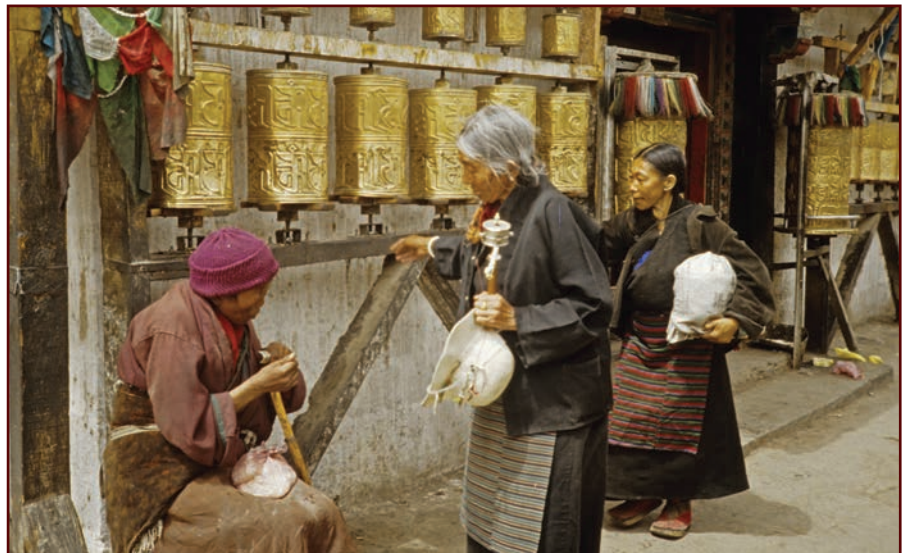
Le Potala - Lhassa 1986