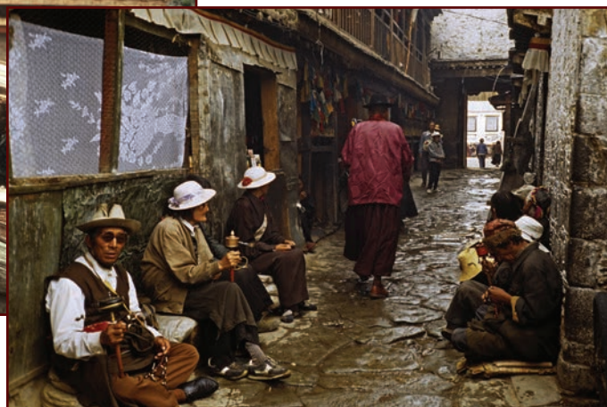
Rue de Lhasa - 1996