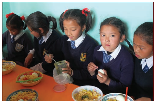
Repas à l'école de Ravangla

Mes responsabilités ont pratiquement doublé et c'est très exigeant, mais j'en suis heureux. Le Covid semble avoir totalement disparu. Les gens sont soulagés et les visages souriants débarrassés des masques.