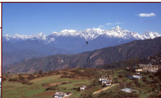
Camp de Ravangla

n'ait aucun territoire national à défendre, l'Inde a constitué à l'intérieur de sa propre armée une « armée tibétaine ».